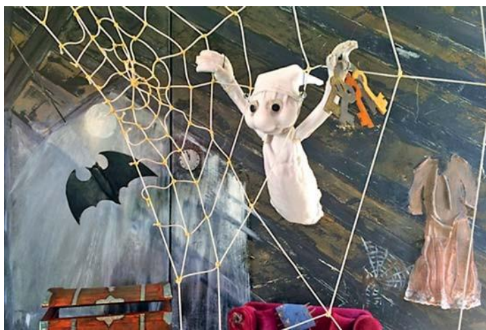
Der freche Poltergeist hat lauter Quatsch und Flausen im Kopf.