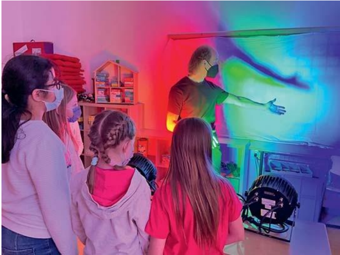
Die Kinder fanden heraus, dass sie nicht unbedingt auf Regenwetter warten müssen, um einen Regenbogen zu entdecken.

Neue Workshops der Initiative Junge Forscher und variado begeisterten Viertklässler