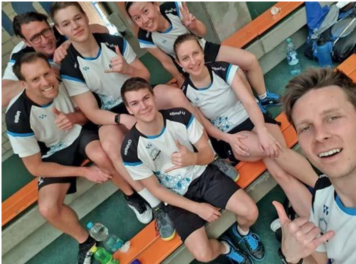
1. Mannschaft Badminton (Meisterteam).

Aufstieg in die Verbandsliga größter Erfolg der Vereinsgeschichte im Badminton des ASV-Bellenberg