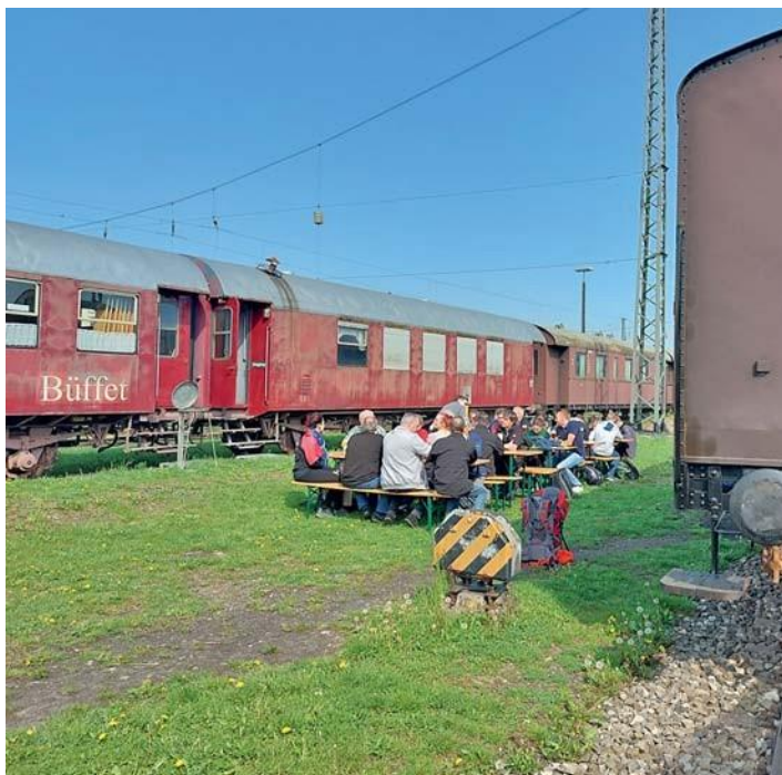
Frühstück in außergewöhnlicher Atmosphäre.