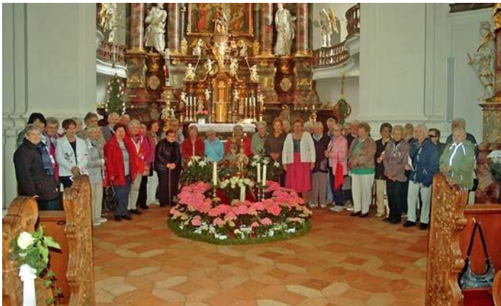
Senioren in der schönsten Dorfkirche der Welt.