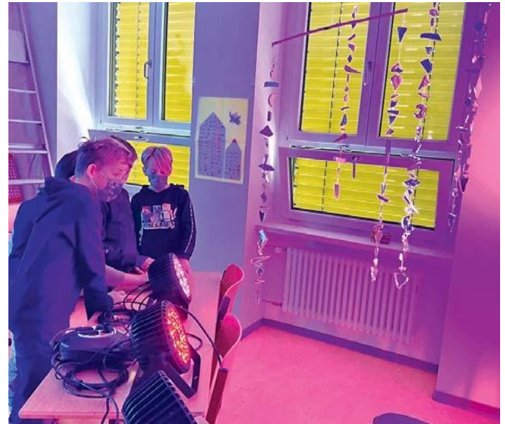
Wie wirkt Spiegelglas, wenn ich es drehe und gleichzeitig mit verschiedenen Farben beleuchte?