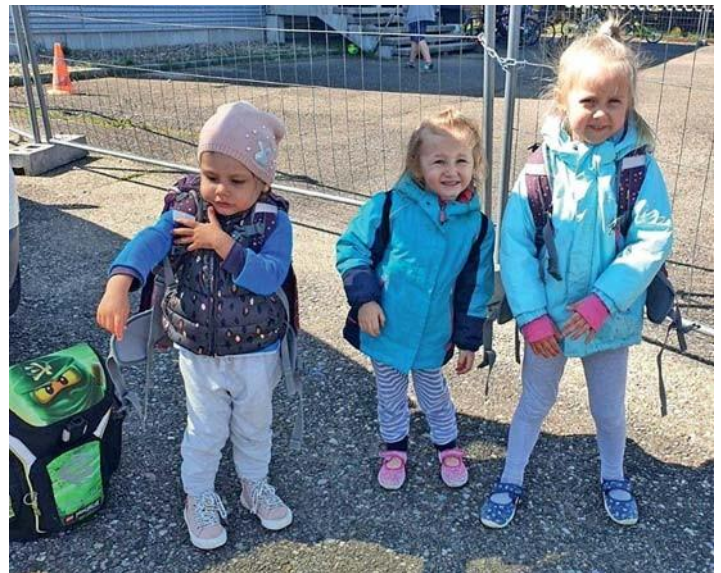
Kinder aus Memmingen probieren die Schulranzen.

Die Lindenschule Bellenberg und der Elternbeirat bedanken sich herzlich bei allen Unterstützern. Der Lohn hierfür sind die strahlenden Augen aller Beteiligten.