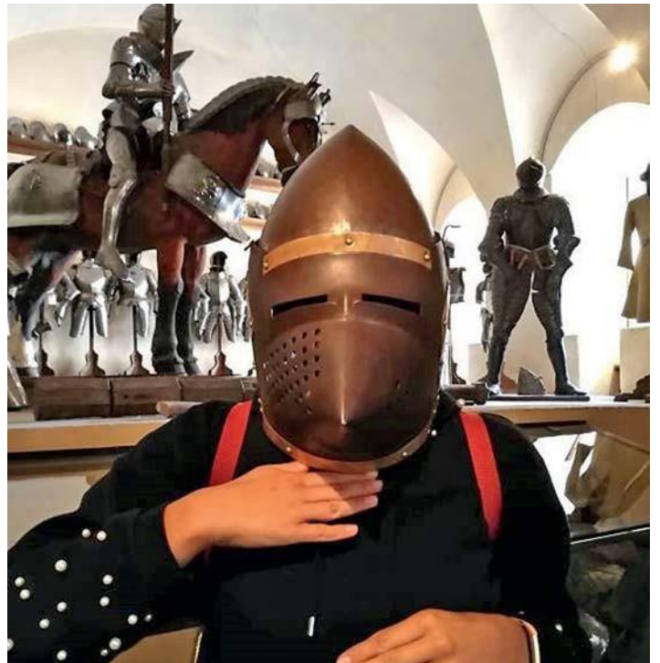
Einblick ins Ritterleben bei einem Burgbesuch: Eine Freizeitteilnehmerin probiert einen Helm auf.