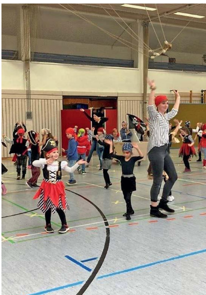
Hochkonzentriert präsentierten die Vorschüler ihren Piratentanz: