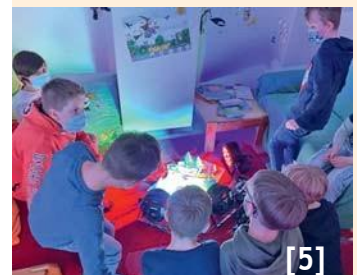
Junge Forscher [5]