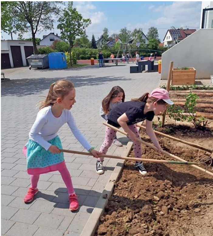
Die kleinen Gärtnerinnen und Gärtner sind fleißig bei der Arbeit.

den Erdbeeren, Salat, Kartoffeln, Zwiebel, Zucchini und Erbsen eingepflanzt und ausgesät. Anschließend wurde ein Gießdienst bestimmt, um auch die Verantwortung für die Pflege und Versorgung der Pflanzen ein Stück weit den Kindern zu übergeben. Die Schülerinnen und Schüler sind schon ganz gespannt auf die Ernte und freuen sich bereits sehr darauf, ihr selbst angebautes Gemüse zu verarbeiten und mit viel Genuss zu verzehren.