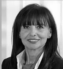
Billur Habermann Immobilien

Tel. 0731 709-881 frank.grathwohl@ spk-nu-ill.de