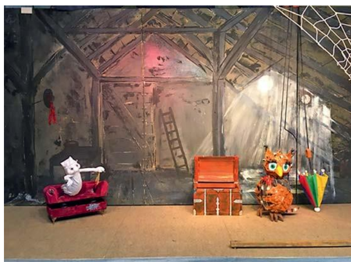
Auf dem Dachboden des Burgmuseums erwacht das kleine Gespenst.