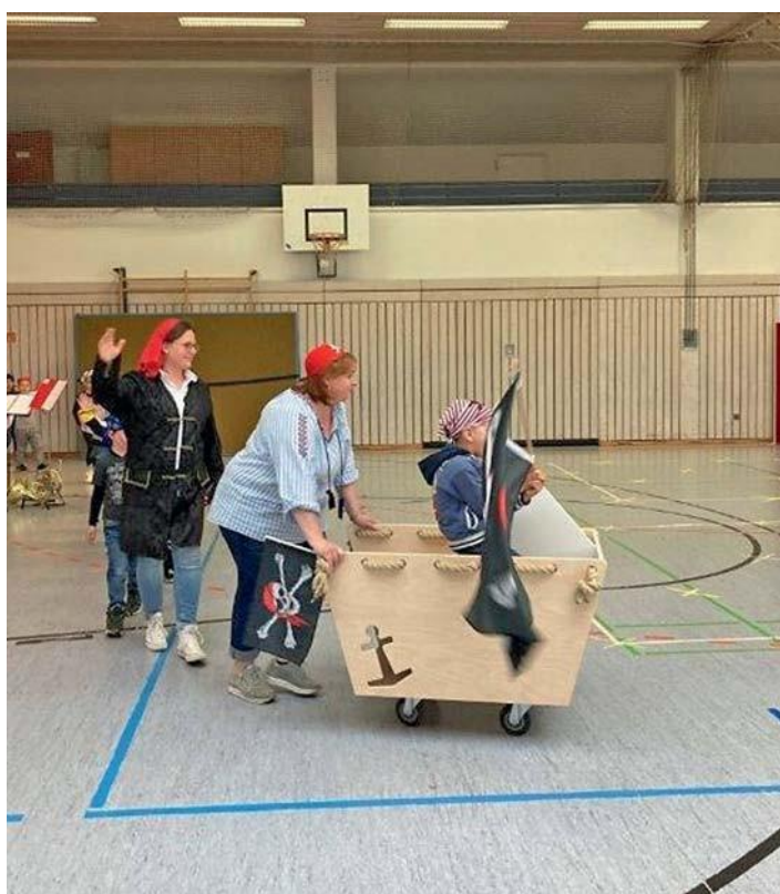
Mit einem „echten“ Schiff marschierten die Piraten ein.