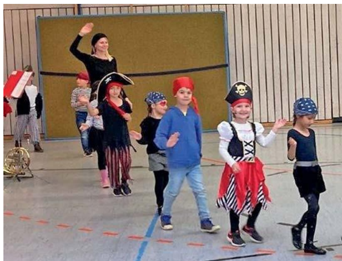
Endlich wieder ein Tanz in den Mai! Die Freude stand den Kindern ins Gesicht geschrieben.

wurde fleißig auf dem Parkplatz bei der Schule oder in der Turnhalle für den großen Tag geprobt. Zum Auftritt erschienen dann alle Kinder und Erzieherinnen im Piratenoutfit mit schwenkenden Fahnen. Die anfängliche Nervosität verschwand bereits nach wenigen Takten. Was dann folgte war ein toller, wirklich mehr als gelungener Auftritt, der mit begeistertem Applaus und viel Lob honoriert wurde.