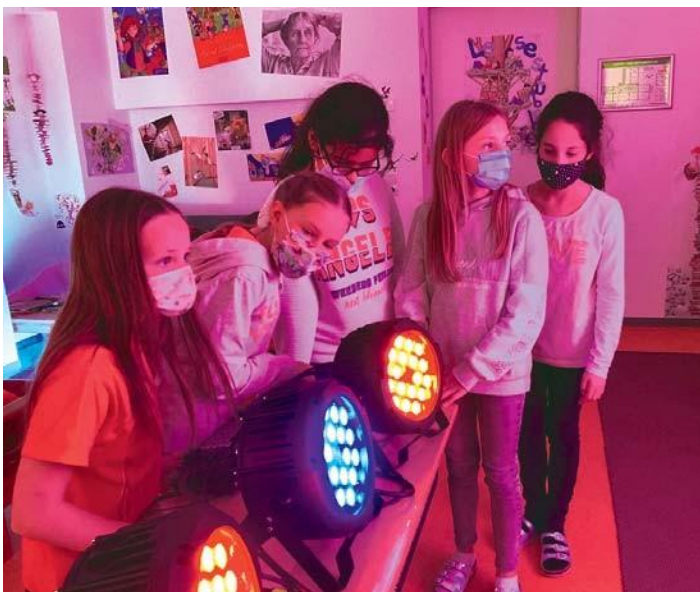
Die Viertklässler zauberten aus den Farben blau, gelb und rot selbstständig die Farbe weiß.

quelle für uns Menschen, Natur und auch Technik.“, weiß IJF-Projektleiter Daniel Friedrich. Neben grundlegenden Informationen erhielten die Kinder viel Zeit, selbst aktiv zu werden. Dazu hatte variado verschiedene Experimentierstationen im Gepäck. „und dabei kommt der größte Teil von der Sonne und damit von außerhalb der Erde.“ Und so endete der Projekttag mit vielen Licht- und AHA-Momenten.