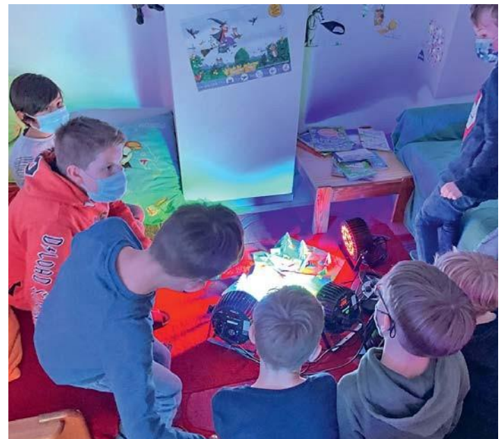
Hier durften die Kinder selbst kreativ werden und spielerisch herausfinden, dass z. B. die Farbe blau durch rotes Licht 'aufgefressen' wird und schwarz erscheint.

Wie verändert sich eine Stadt bei unterschiedlichem Lichteinfall?