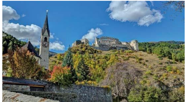
Burgruine Lichtenberg in Prad: