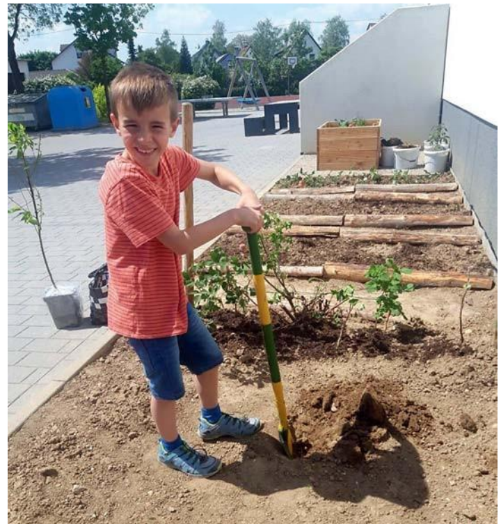
Ob bei Hitze und Sonnenschein oder bei Regen – die Gartenarbeit macht den Kindern Spaß.