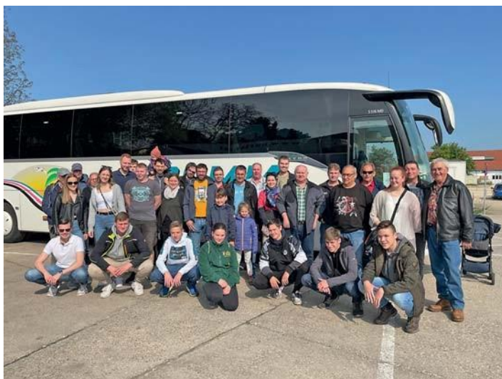
Mitglieder der Feuerwehr beim Ausflug.