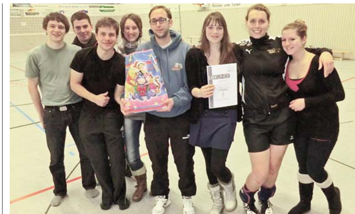
Team „Die Tobis mit Anhang“ des ASV Bellenberg.