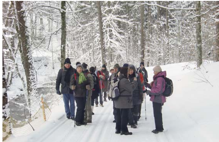
Die Wandergruppe des Athletiksportvereines im Stillach-Tal.

Bei strahlend blauem Himmel, in tief verschneiter Winterlandschaft waren 22 Wanderer des Athletiksportvereines unterwegs. Mit dem Zug erreichten sie bei klirrender Kälte Oberstdorf und fuhren mit dem Bus ins Stillach-Tal. An der Schiflugschanze begann die Wandertour. Entlang der Stillach, umgeben von den verschneiten Gipfeln des Himmelschrofen, des vorderen und hinteren Wildgundkopfes und des Schmalhornes, ging es an Birgsau vorbei nach Einödsbach, dem südlichsten bewohnten Ort in der Bundesrepublik (1.142 m). Nach einer ausgiebigen Mittagsrast im Gasthof machten sich die ASV'ler auf den Rückweg. Immer bergab erreichte man bei strahlendem Wetter, an Birgsau vorbei, die Bushaltestelle an der Fellhorn-Seilbahn und nach kurzer Fahrt Oberstdorf. Hier hatte man noch die Gelegenheit für einen kurzen Aufenthalt in Oberstdorf. Auf der Heimfahrt wurde immer wieder von der verschneiten Landschaft, dem Sonnenschein, den Bergen und der Wanderstrecke geschwärmt. Ein Wandertag, der in sehr guter Erinnerung bleiben wird.