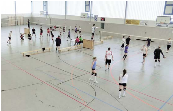
Wettkampfzeit in der ASV-Halle.

Donnerstag, 1. März 2012, ab 20.30 Uhr: Heimspiel der Mixed-Mannschaft des ASV-Bellenberg gegen des TSV Erbach.