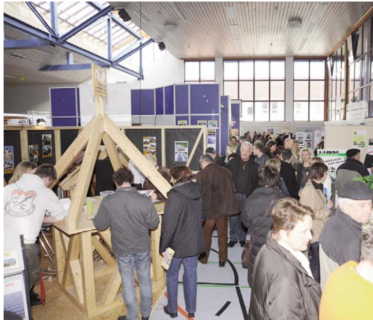
Unser Bild zeigt Besucher bei der Gewerbeschau im Jahr 2009.