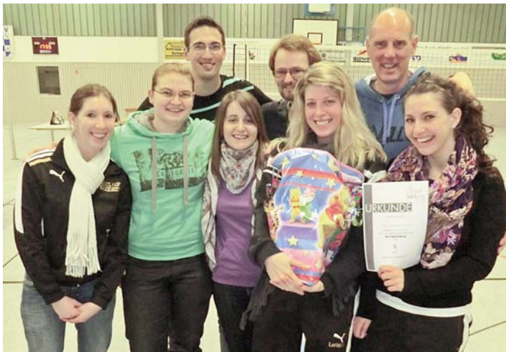
Team „Jule und der Rest“ des ASV Bellenberg und SC Vöhringen.