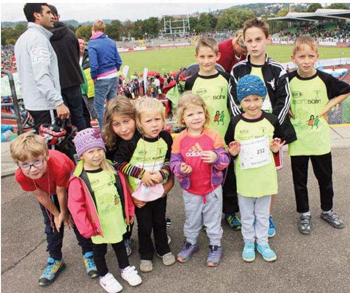
Bereit zum Einstein-Marathon.