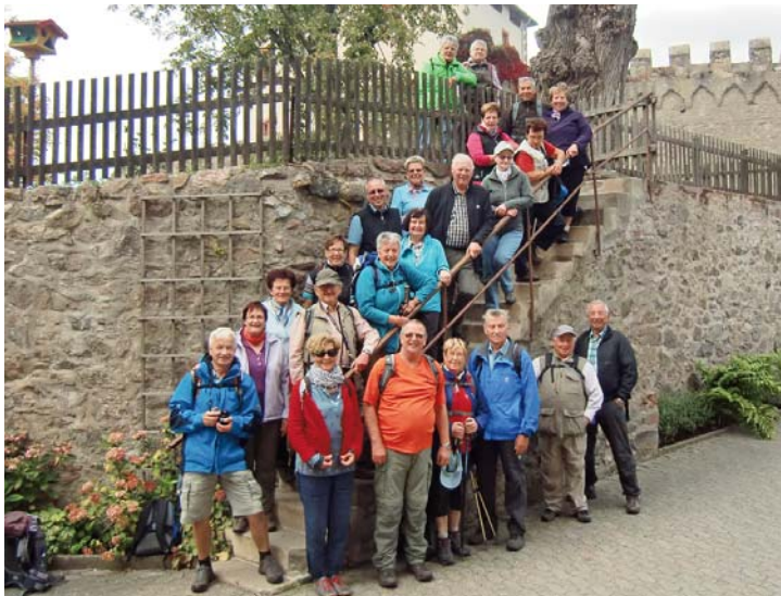
Die Wandergruppe auf Tour.

Pilz- und Walnussammler kamen voll auf ihre Kosten. Nach der Rückkehr gab es Kaffee und Kuchen und einige gingen zum Schwimmen. Nach dem Abendessen mit dem täglichen 3-Gänge-Wahlmenü wurde gekegelt. Über Reichelsheim, Burg Rodenstein und Schloß Reichenberg führte die nächste Tour. Ein Spieleabend schloss sich an. Der übliche Kulturtag mit einer organisierten Stadtführung in Michelstadt und der Besuch des Lustgartens und der Altstadt in Erbach war eine willkommene Abwechslung. Die Stadtführerin vermittelte viel Begeisterung für die Sehenswürdigkeiten des mittelalterlichen Städtchens, unter anderem besuchten sie den Sitzungssaal des historischen Rathauses. Ein Gesangsabend mit Gitarrenbegleitung durch einen Wanderkameraden rundete den Tag ab. Die Mossautalwanderung und die Abschlusswanderung von Erbach über das Wildgehege „Brudergrund“ beendeten die Wanderwoche, die allen Beteiligten sehr gut gefallen hat. Der Odenwald ist eine hügelige Mittelgebirgslandschaft mit Erhebungen bis 500 m Höhe, viel Mischwald und Grasland. Auffällig waren die vielen Walnussbäume und die Norwegerpferde auf den Weiden. Lobenswert war die ausgezeichnete Ausschilderung der zahlreichen Wanderwege, die die Orientierung leicht machte. Leider konnte der langjährige Abteilungsleiter und Wanderführer Rudi Cermak krankheitshalber nicht teilnehmen.