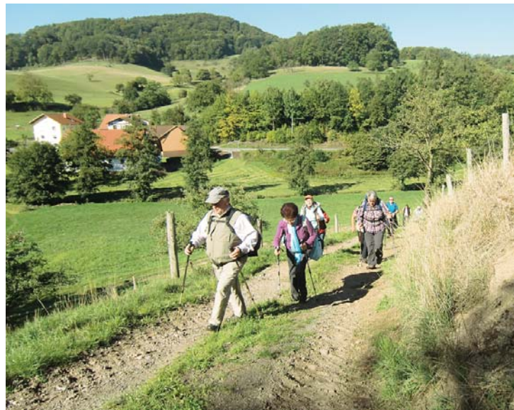
Ausblick bei der Wanderung.