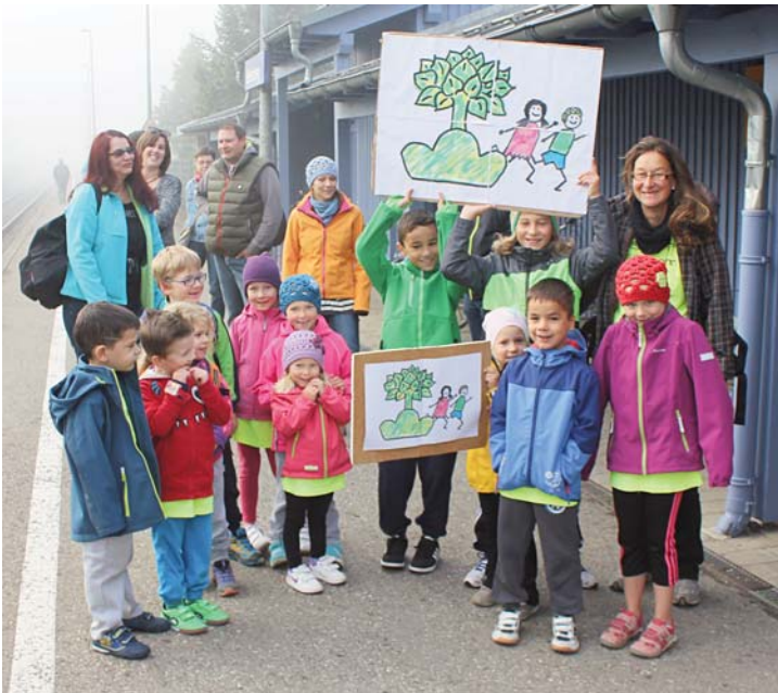
Die Bambinis mit ihren Eltern am Bellenberger Bahnhof.

So freuen sich alle schon wieder auf die nächsten Nachwuchsläufe des Einstein Marathons am 17. September 2016. Bitte vormerken: Gruppenanmeldung ist im Juni/Juli 2016.