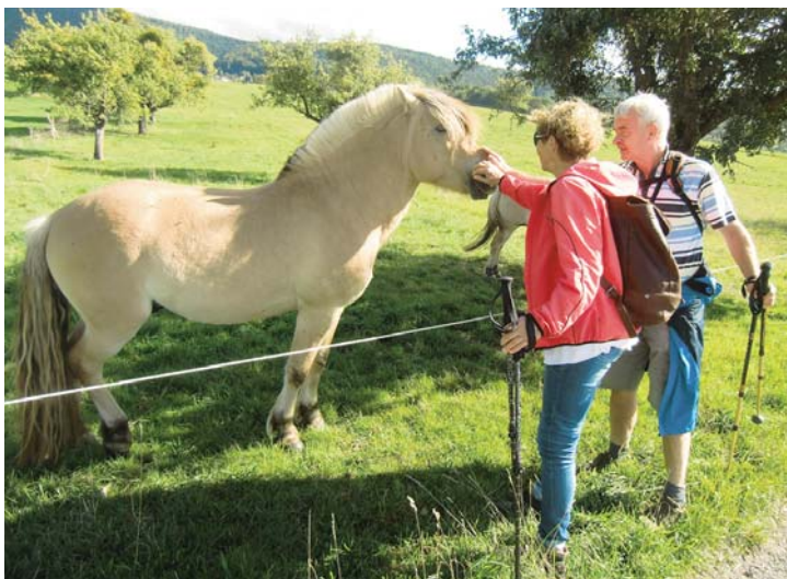
Die Wanderer bei Norwegerpferden auf einer Weide.