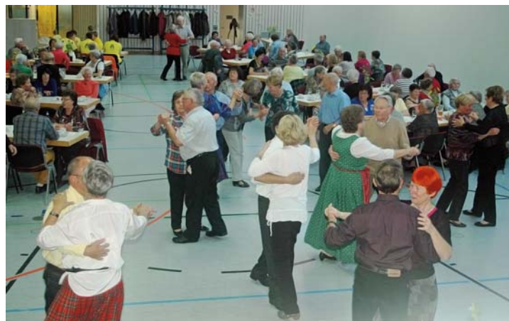
Viel Spaß hatten die Tänzer beim letzten Tanz-Kaffee im November 2015.

Der nächste Tanzkaffee mit den Oldie Dreams findet am Samstag, 9. April 2016, von 14 Uhr bis 18 Uhr, statt. Bei Kaffee und Kuchen können sich alle, die gerne tanzen (nicht nur Senioren!), einen Nachmittag lang amüsieren. Der Eintritt ist frei.