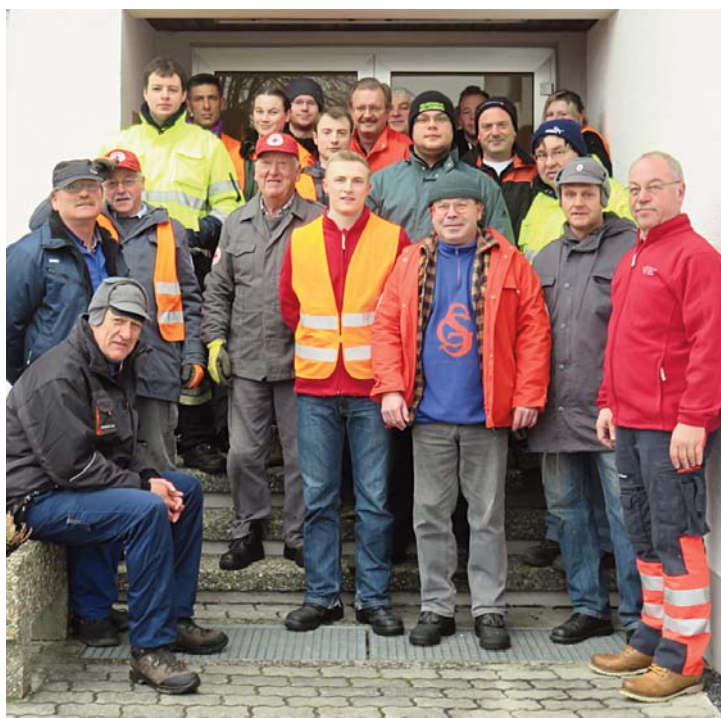
Unser Bild zeigt die Altpapiersammler der Rot-Kreuz-Bereitschaft vor dem Rot-Kreuz-Haus.