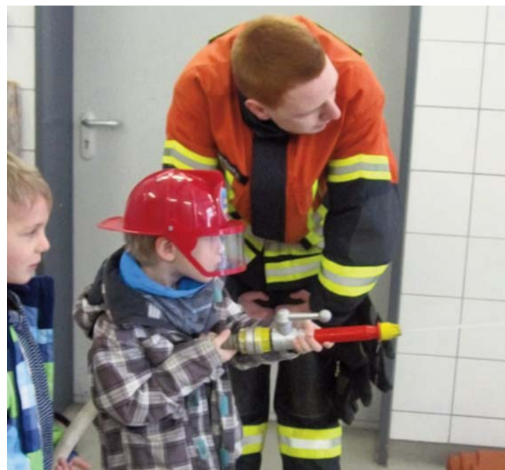
Auch das Wasserspritzen will gelernt sein.