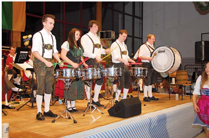
Unser Bild zeigt die Schlagzeuger bei der Percussionseinlage.