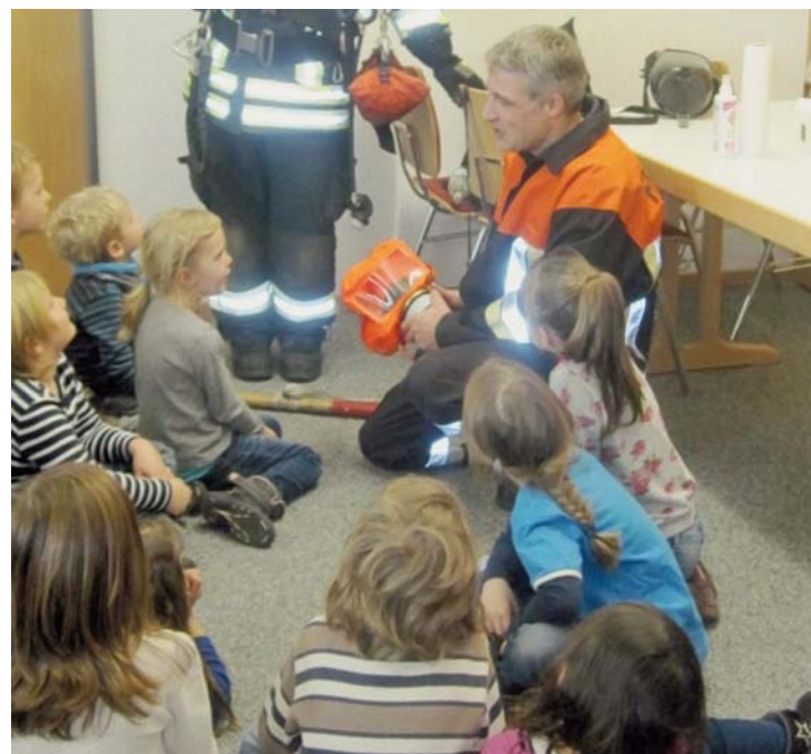
Aufmerksam hören die Kinder dem Feuerwehrmann zu.

Besonders viel Spaß hatten die Kinder beim Wasser spritzen und sie stellten fest, dass es gar nicht so einfach ist, das Ziel zu treffen. Um den Kindern die Angst vor Atemschutzträgern zu nehmen, konnten die Kinder beobachten, wie sich ein Feuerwehrmann ein Atemschutzgerät anzog. Dabei erkannten die Vorschulkinder, dass hinter der Maske trotz ungewöhnlicher Atemgeräusche immer noch der gleiche Feuerwehrmann steckt. Für alle Kinder waren es spannende und interessante Tage mit und bei der Feuerwehr! Herzlichen Dank der Freiwilligen Feuerwehr für ihr Engagement!