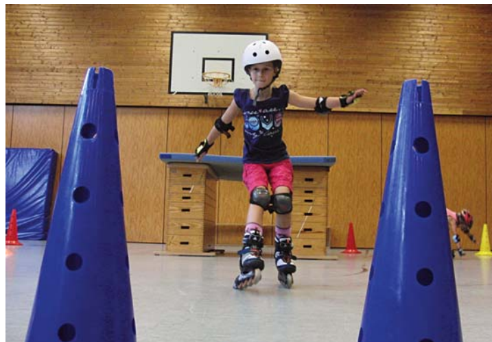
Inlinerkurs bei der KiSS Bellenberg.

Für das Schuljahr 2016/2017 suchen wir zwei junge Leute bis 26 Jahre, die bei uns ein Freiwilliges Soziales Jahr (FSJ) im Sport leisten wollen. Weitere Informationen zur FSJ Stellenausschreibung und zum FSJ-Jahr finden Sie auf der Homepage der KiSS Bellenberg www.kiss-bellenberg.de unter „Aktuelles“ oder per Mail an den Leiter der Kindersportschulen leiter@kiss-bellenberg.de .