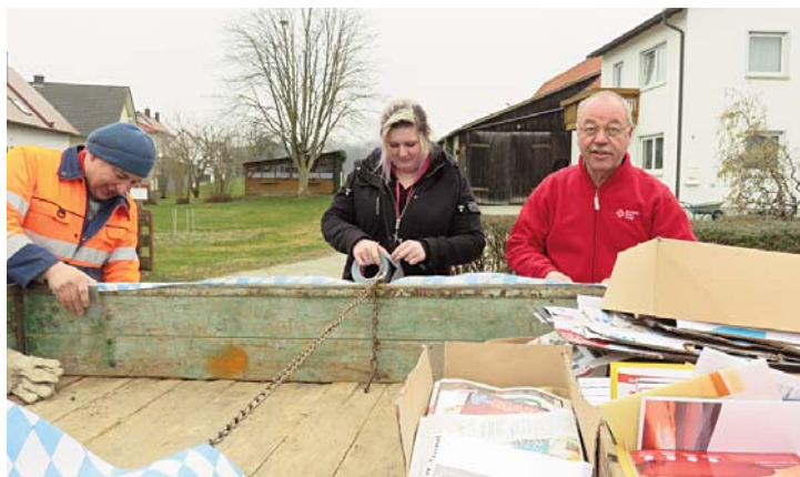
Fleißige Helfer bei der Altpapiersammlung.

Noch einmal ein herzliches Vergelt's Gott an alle, die das Altpapier-Sammeln möglich machen. Das BRK hofft, dass sie noch lange weitersammeln können.