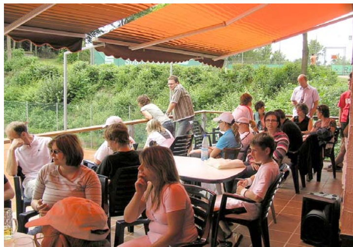
Viele Zuschauer verfolgten die spannenden Tennismatches von der Terrasse des Tennisheimes aus.