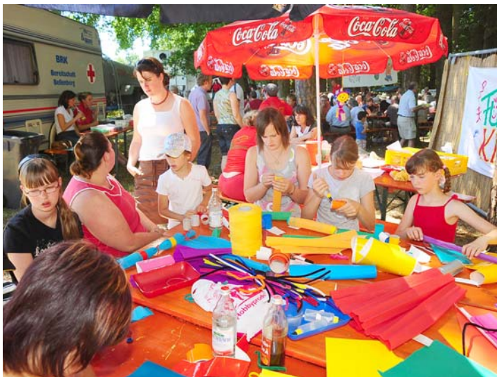
Beim Waldfest wurden den Kindern viele Attraktionen angeboten.