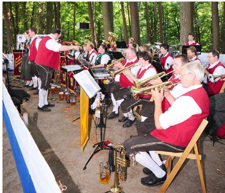
Bei lauen Temperaturen sorgte die Musikgesellschaft selbst für eine tolle Stimmung.