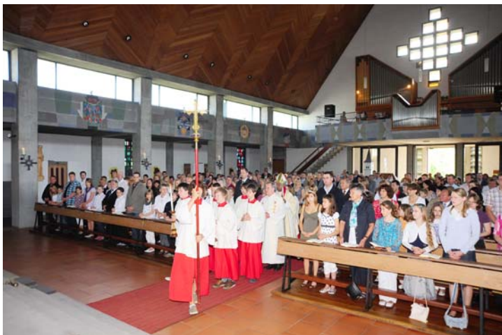
Festlicher Einzug des Bischofs in die Pfarrkirche beim Firmgottesdienst am Samstag, 21. Juni 2008.