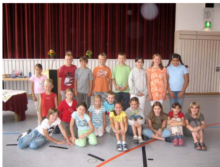
Die Kinder mit besonderem sozialem Engagement.