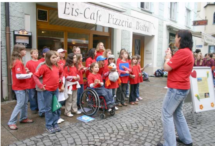
Die „Music-Kids“ bei ihrem Auftritt in der Fußgängerzone in Füssen.

Am Pfingstmontag erreichte die Jugendkapelle TABBS beim Jugendcup im Rahmen des 110-jährigen Jubiläums des Musikvereines Kellmünz einen sensationellen zweiten Platz. Alle Jungmusiker bedanken sich für die tatkräftige Unterstützung der mitgereisten Fans. Unterlegen waren die jungen Musikantinnen und Musikanten dem Sieger, der Jugendkapelle Dettingen, nur in der sportlichen Wertung.