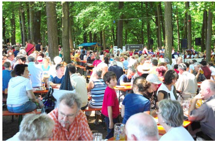
Viele Besucher kamen zum schattigen Waldfestplatz auf den Schloßberg, um ein paar gesellige Stunden zu genießen.