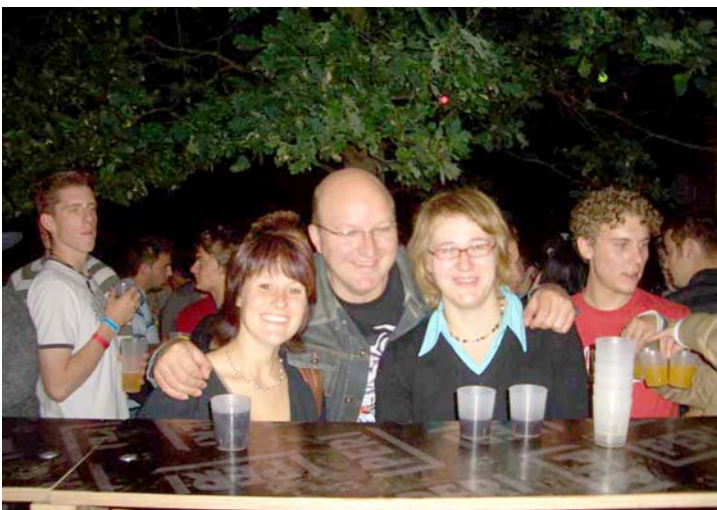
Auch in diesem Jahr war der PartyShot in Bellenberg ein großer Erfolg. Beinahe 1.200 Partygäste aus nah und fern hatten sich auf dem Schloßberg zusammen gefunden, um die besondere Atmosphäre auf dem Schloßberg zu genießen.

Mit viel Freude und Begeisterung feierten die Schüler und Schülerinnen der beiden 1. Klassen am Donnerstag, 10. Juli 2008, ihr Buchstabenfest. Alle Eltern, Omas und Opas waren stolz auf die ABC-Schützen.