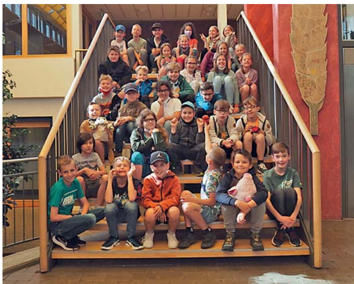
Nach langer Zeit der Vorfreude, gepaart mit der ständigen Ungewissheit, ob sie überhaupt stattfinden kann, war die Schullandheimzeit endlich gekommen!