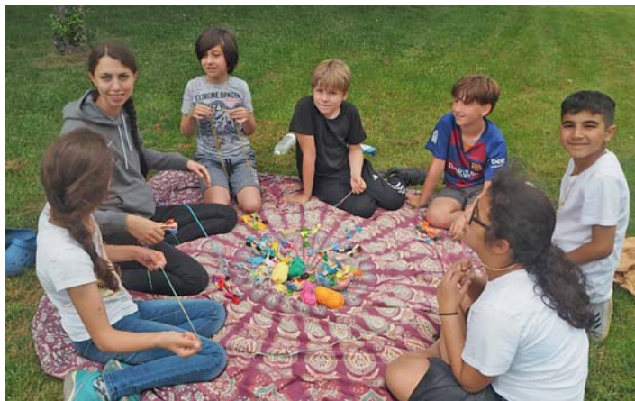
Bei kreativen Workshops durften die Viertklässler ihre handwerkliche Geschicklichkeit und ihre künstlerischen Fähigkeiten unter Beweis stellen.

Leider hieß es am nächsten Morgen nach dem Frühstück schon wieder Koffer packen. Mit viel Teamgeist ausgestattet – müde, aber um viele Erfahrungen reicher – traten die „Großen“ der Lindenschule die Heimfahrt an und wurden an der Schule schon von zahlreichen Eltern sehnsüchtig erwartet. An dieser Stelle möchten sich alle Viertklässler ganz herzlich beim Elternbeirat und bei der Gemeinde für den großzügigen Zuschuss zur Schullandheimfahrt bedanken.