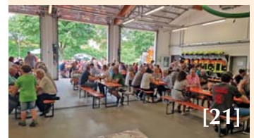
Frühschoppen bei der Feuerwehr