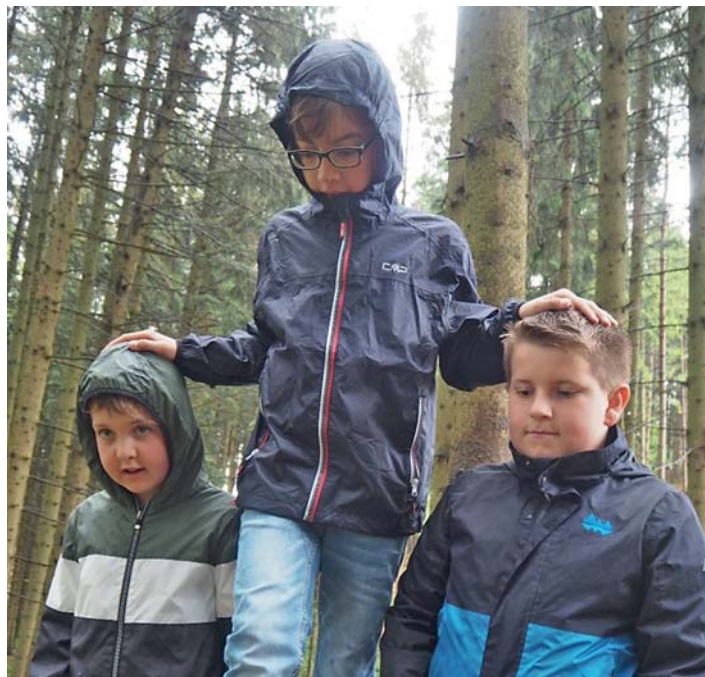
Mit Unterstützung von je zwei „Schutzengeln“ konnte jede Hürde gemeistert werden. Die Schüler und Schülerinnen erkannten schnell, wie wichtig der Zusammenhalt, das Vertrauen und die Absprachen im Team sind.