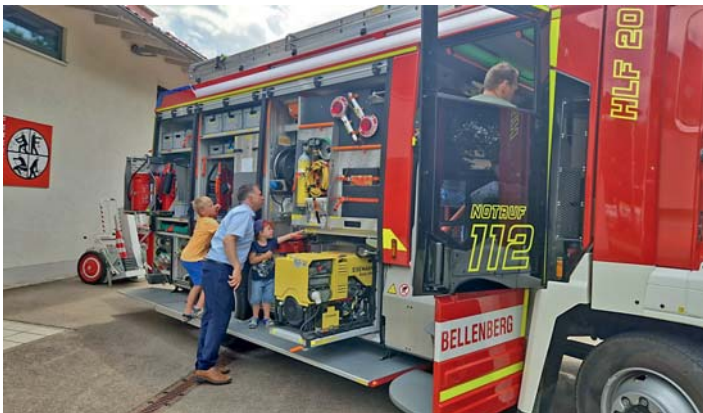
Ausstellung des neuen Feuerwehrautos

gangenen Jahr neu angeschaffte Feuerwehrfahrzeug zu besichtigen und wer wollte, bekam dieses ausführlich erklärt und evtl. aufkommende Fragen beantwortet. Hierbei standen die Kameradinnen und Kameraden der aktiven Wehr Rede und Antwort. Auch die Jugendfeuerwehr leistete ihren Beitrag und unterstützte den Feuerwehrverein tatkräftig. Insgesamt war es ein gelungenes Frühschoppen und die Freiwillige Feuerwehr freut sich schon, seine Gäste auch im kommenden Jahr wieder begrüßen zu dürfen.