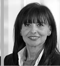
Billur Habermann Immobilien

Tel. 0731 709-881 frank.grathwohl@ spk-nu-ill.de