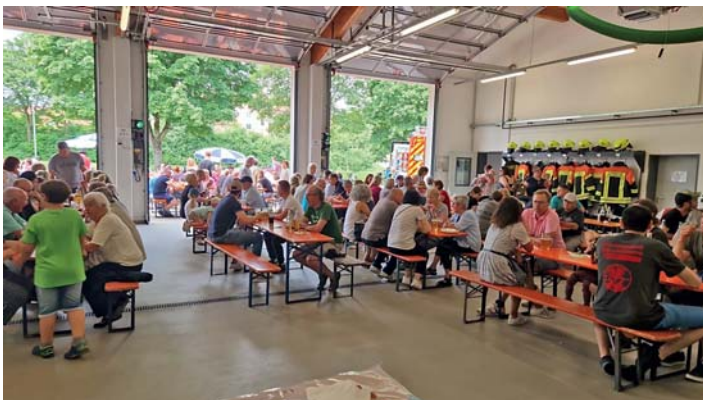
Frühschoppen 2022 in gemütlicher Runde.