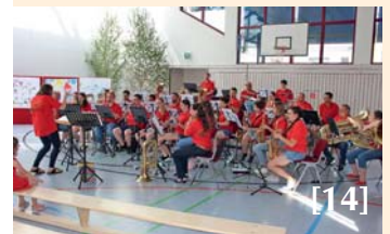
Bilder einer Ausstellung