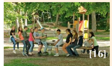
Besuch bei Buchhandlung