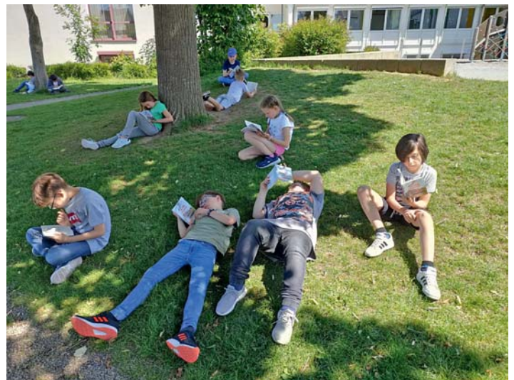
In der Schule starteten die Kinder bald darauf mit dem Lesen – und das machte draußen auf dem Pausenhof gleich nochmal so viel Spaß.