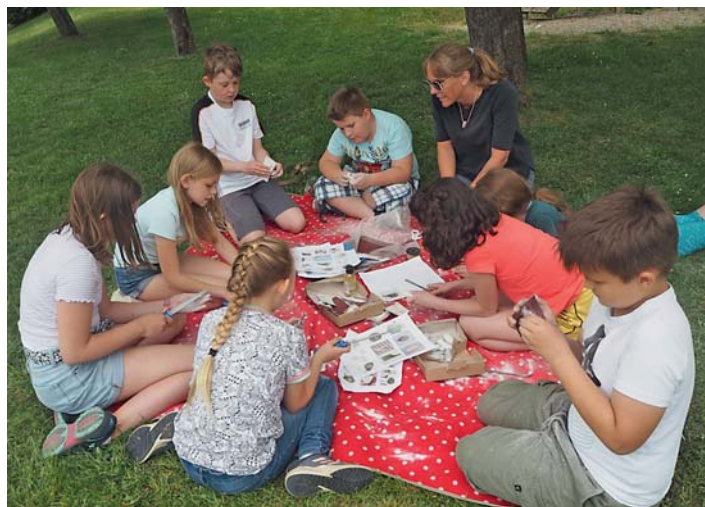
Die Schülerinnen und Schüler fertigten bunte T-Shirts, Speckstein-Ketten, geknüpfte Armbänder sowie ein kunterbuntes Klecksbild mit Wasserspritzpistolen an.