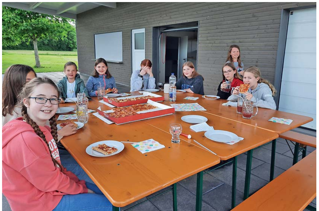
Die Pizza hat allen Mädchen hervorragend geschmeckt.