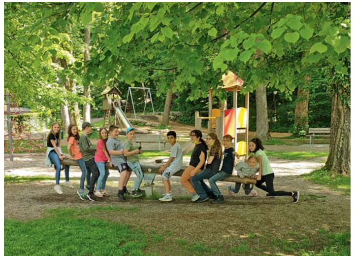
Die Viertklässler genossen es nach langer Zeit wieder ausgelassen miteinander spielen zu können.

man, den die Buchhändlerinnen und Buchhändler auf eigene Kosten bestellen. Ziel der Aktion ist es, die Kinder mit spannenden Geschichten für das Lesen zu begeistern und ihre Lesekompetenz zu stärken. Mit der neuen Lektüre und viel Lesemotivation im Gepäck setzten die Klassen ihren kleinen Ausflug fort und ließen sich eine oder auch zwei Kugeln Eis schmecken. Auf dem Weierspielplatz genossen sie anschließend das gute Wetter und hatten Zeit, um ausgiebig zu klettern, zu hüpfen und gemeinsam zu spielen. Gegen Mittag machten sie sich schließlich wieder auf den Weg zum Bahnhof, um mit dem Zug nach Bellenberg zurückzufahren.