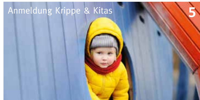
Anmeldung Krippe & Kitas