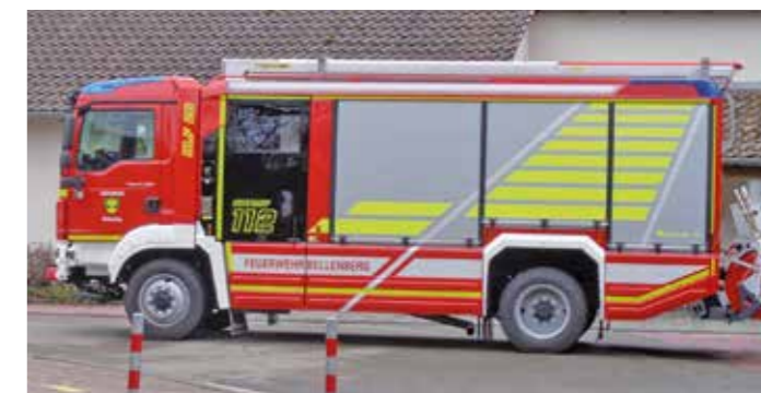
Auch die Feuerwehr wurde miteinbezogen.

Vorfeld besprochen, warum der Alarm ertönt und wie sie sich in so einem Fall verhalten sollen.