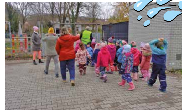
Die Räumungsübung fand ohne Zwischenfälle statt.

Damit im Ernstfall kein Chaos ausbricht, gibt es für jede Gruppe und für jeden Raum im Haus des Kindes einen vorgeschriebenen Fluchtwegeplan mit festgelegten Sammelpunkten. Dort angekommen wurde abermals durchgezählt, um sicherzugehen, dass niemand in den Räumlichkeiten zurückgeblieben und, dass kein Kind aus Angst umgedreht hat oder um sein liebstes