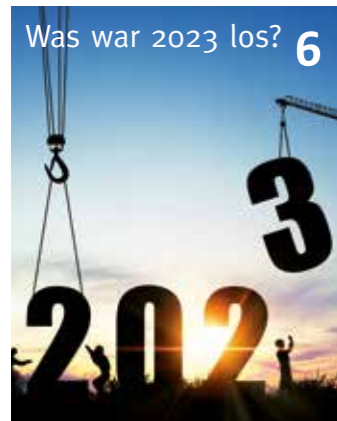
Was war 2023 los?