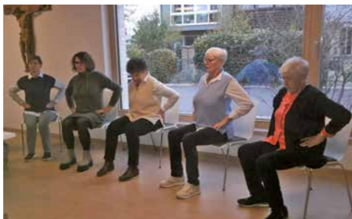
Der Körper und Gleichgewichtssinn soll so gestärkt werden, um dadurch auch Stürzen vorbeugen können.