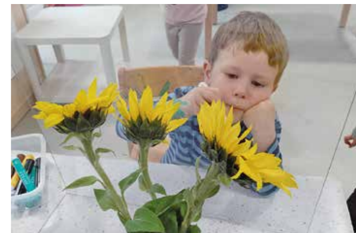
Auch Samuel überträgt das Gesehene auf die Glasscheibe.