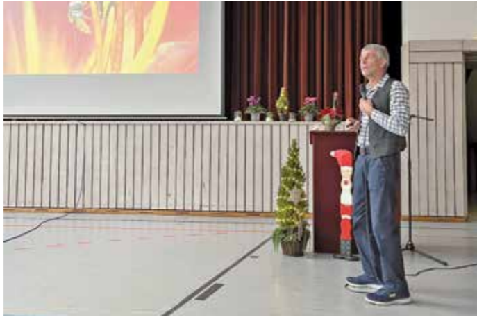
Der Vortrag „Manche mögen's heiß – Stauden für jeden Gartenplatz“ sollte Anregungen für neue Bepflanzungen im eigenen Garten liefern.

Diesen Herbst stand ein heißes Thema auf der Tagesordnung. Unter dem Motto „Manche mögen's heiß“ referierte der Kreisfachberater Rudolf Siehler über Stauden für jeden Gartenplatz.