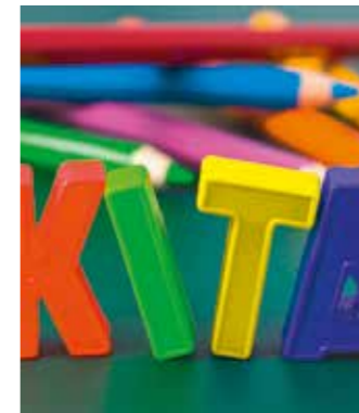
Wichtiger Termin: Anmeldewoche in der Kita „Guter Hirte“.

Die Anmeldewoche für die Krippe im Haus des Kindes „Guter Hirte“ findet für das Krippenjahr 2024/2025 vom 05.02.2024 bis einschl. 09.02.2024 statt.