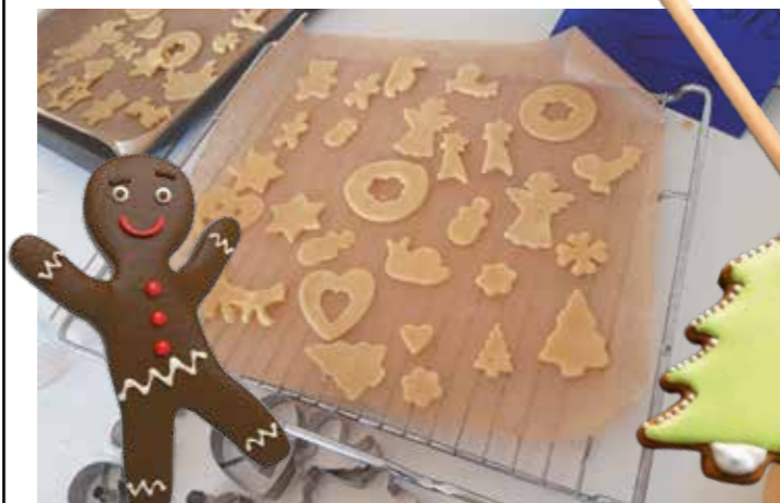
Großer Spaß beim Backen mit leckeren Ergebnissen.