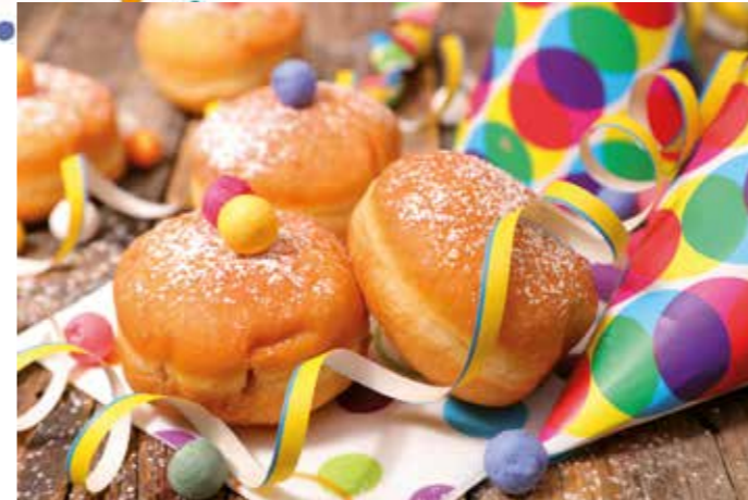
Für das leibliche Wohl ist gesorgt beim nächsten Rathaussturm.

Im kommenden Jahr werden wir, die Narrenzunft Bellenberger Lacha-Dreggler e. V., ganz im Sinne von „Gemeinsam sind wir stark“ in Zusammenarbeit mit der Gemeinde Bellenberg, gemeinsam einen Rathaussturm veranstalten. Wir laden euch herzlich dazu ein dabei zu sein, wenn die Narren die Regentschaft über das Rathaus in Bellenberg übernehmen.