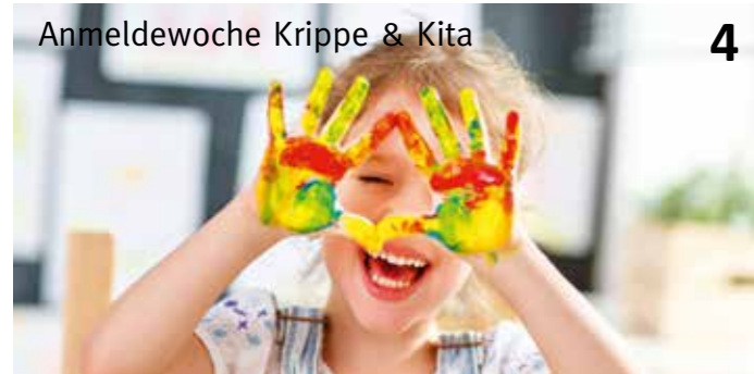
Anmeldewoche Krippe & Kita