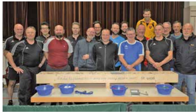
Nur strahlende Sieger: Die Tischtennis-Abteilung des ASV Bellenberg.

Leider musste die Abteilung in der gerade abgeschlossenen Vorrunde den Ausfall von 2 Spielern der I. Mannschaft verkraften. Deren Fehlen schlägt sich in den Ergebnissen der Mannschaften nieder. Trotzdem