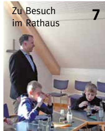
Zu Besuch im Rathaus