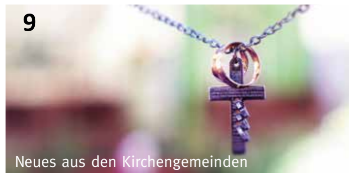
Neues aus den Kirchengemeinden