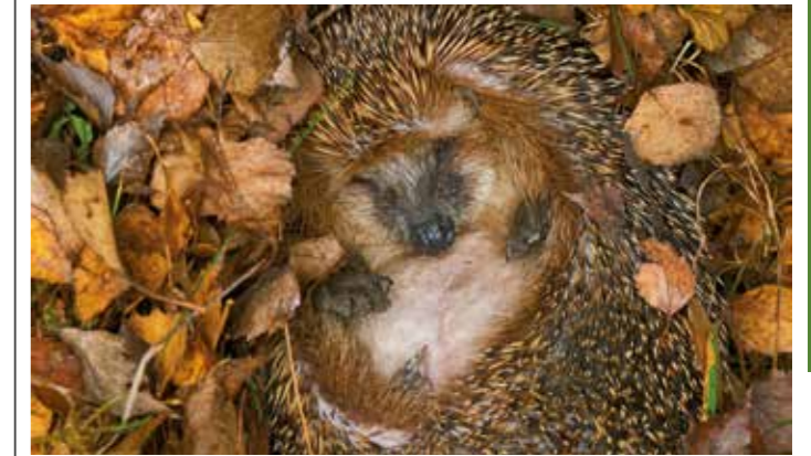
Der Großteil der Igel befindet sich im Winterschlaf.