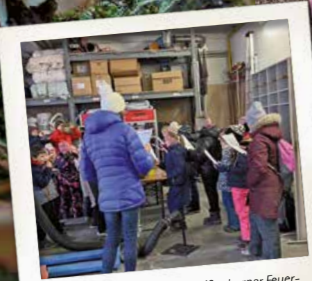
Abschlussständchen in der Weißenhorner Feuerwehr.