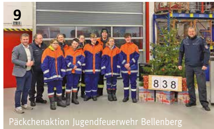
Päckchenaktion Jugendfeuerwehr Bellenberg