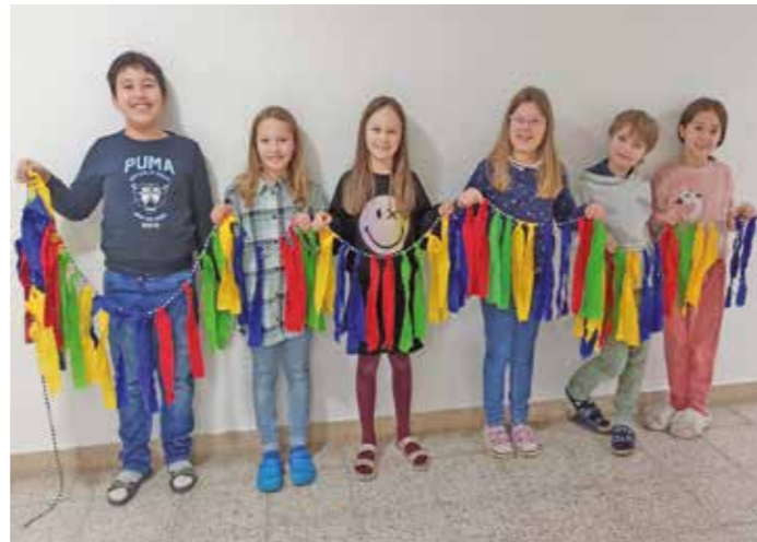
Bunte Girlanden für den Rathaussturm. Die Schülerinnen und Schüler der Lindenschule hatten viel Spaß bei den Vorbereitungen.

Vielen Dank an das Organisationsteam des Rathauses und der Narrenzunft für die tolle Idee und die Planung! Die Schulkinder freuen sich auf den besonderen letzten Schultag vor den Faschingsferien. ■