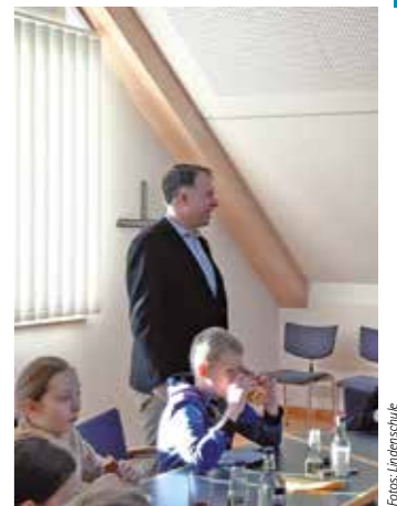
Kinder & Jugend