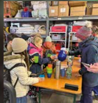
Ein warmer Kinderpunsch tut jetzt gut.

Natürlich konnten sich zwischen durch auch alle ihre mitgebrachte Vesper schmecken lassen. Obwohl alle perfekt mit wetterfester Kleidung ausgerüstet waren, wurde es draußen nach fast eineinhalb Stunden doch ungemütlich und die Schülerinnen und Schüler waren froh, dass sie sich in der Fahrzeughalle der Weißenhorner Feuerwehr aufwärmen konnten und hier von Eltern der Klasse mit Kinderpunsch und Lebkuchen verwöhnt wurden. Nach einem kleinen Weihnachtsständchen machten sich schließlich alle bald wieder auf den Weg zum Bus, der sie zurück zur Lindenschule brachte. Auf jeden Fall waren sich alle einig, dass dies ein gelungener Start in die bevorstehenden Weihnachtsferien war.