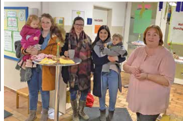
Das Elterncafé fand bereits zum zweiten Mal statt und wurde gut angenommen.