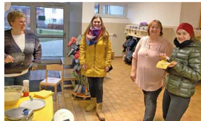
In lockerer Atmosphäre mit frischen Waffeln, Tee und Kaffee trafen sich interessierte Eltern und die Fachkräfte aus dem Haus des Kindes zum Austausch.

Die Resonanz auf das Angebot war durchweg positiv und das Team aus dem Haus des Kindes freute sich sehr über die lockere und entspannte Stimmung. Deshalb wird es das Elterncafé auch weiterhin geben. Langfristiges Ziel ist es, ein regelmäßiges Treffen im Turnus von sechs bis acht Wochen zu etablieren, mal unter einem bestimmten pädagogischen Thema, mal in offener Form.