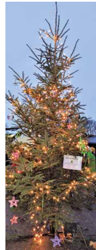
Der Tannenbaum auf dem Bellenberger Weihnachtsmarkt war mit selbstgebastelten Anhängern der Kindergartenkinder geschmückt.

Besonders stolz waren die Vorschulkinder auf den Bellenberger Weihnachtsbaum. Denn an ihm baumelten die schönen Stern- und Tannenbaumanhänger, die von den Kindern der Kindertagesstätte in liebevoller Handarbeit angefertigt wurden.