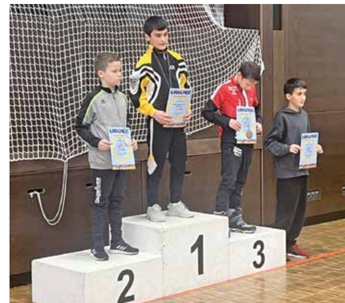
Ein schöner Moment für die siegreichen Athleten.