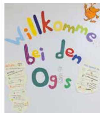
Die Besucher erwartet Einblicke in

Am Tag der Schuleinschreibung öffnet die OGTS ihre Türen in der Lindenschule und bietet zukünftigen Schülern, Eltern und Interessierten die Gelegenheit, die Vielfalt der Einrichtung zu erkunden.