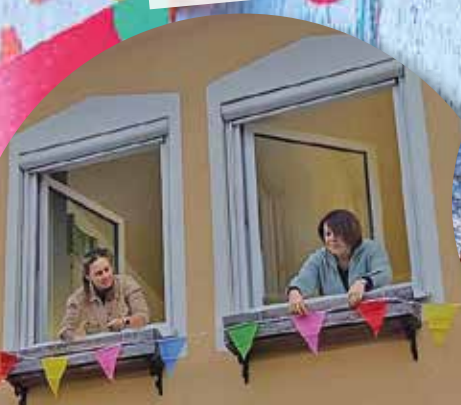
Das Rathaus wurde für die Fasnet bunt geschmückt.