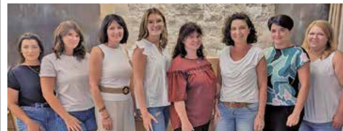
Das OGTS-Team bietet Angebote, die auf die Interessen der Kinder zugeschnitten werden.

Entdecke die Welt der „OGIS“ am Tag der offenen Tür am 12. März, 9 bis 15 Uhr