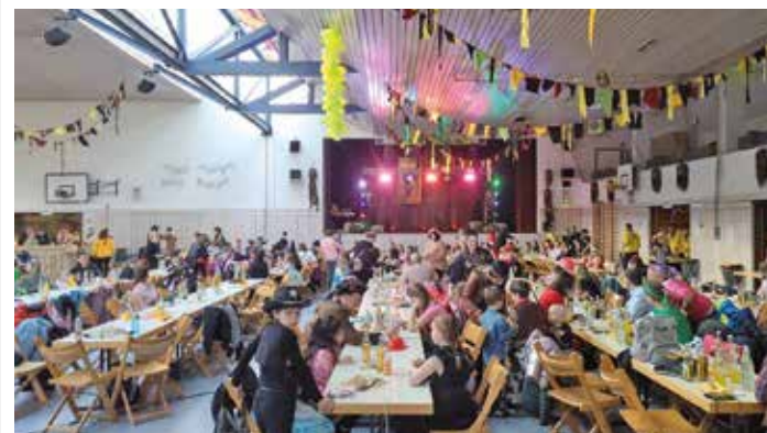
Viele Kinder, egal ob groß ob klein, kamen zum Kinderspaß und verbrachten einen großartigen Nachmittag zusammen mit ihren Familien.

Am vergangenen Rosenmontag veranstaltete die Narrenzunft Bellenberger Lacha-Dreggler e. V. einen bezaubernden Kinderspaß gefolgt von einem traditionellen Brauchtumsabend in der Turn- und Festhalle der Lindenschule in Bellenberg.