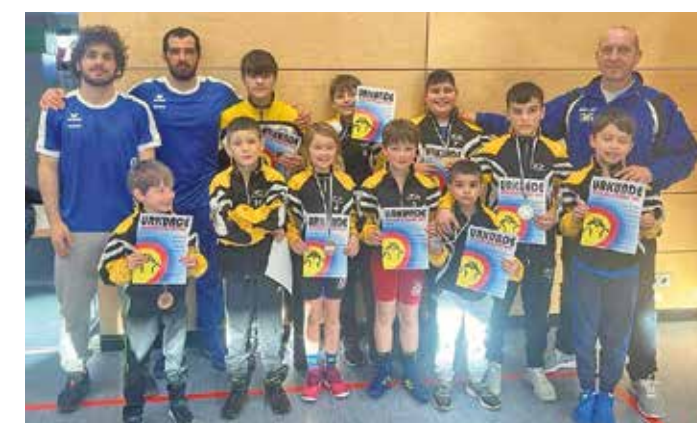
Eine überragende Mannschaftsleistung der Ringerjugend.