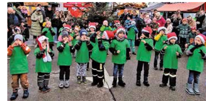
Mit grünen Shirts und weihnachtlicher Kopfbedeckung präsentierten die Vorschulkinder ihren Weihnachtstanz.