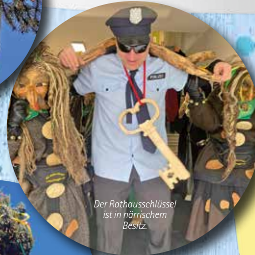
Der Rathauschlüssel ist in närrischem Besitz.