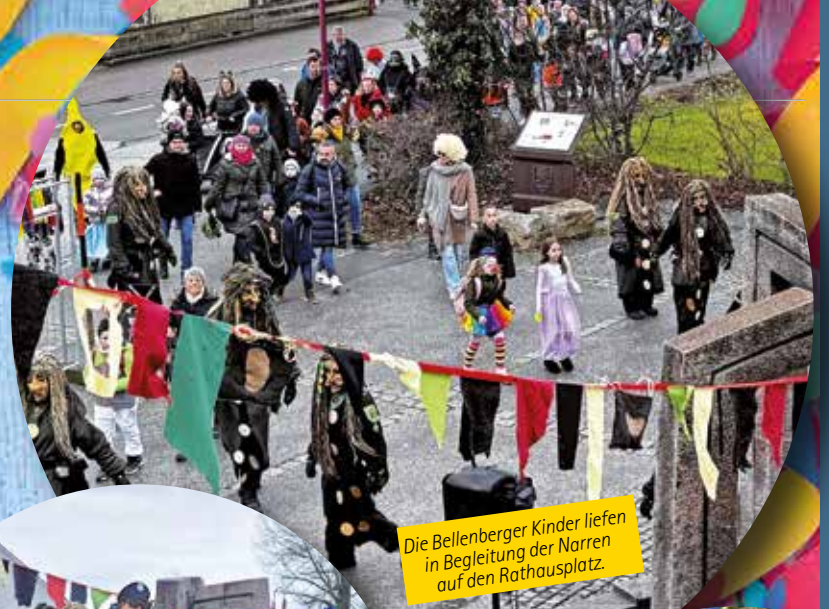
Die Bellenberger Kinder liefen in Begleitung der Narren auf den Rathausplatz.