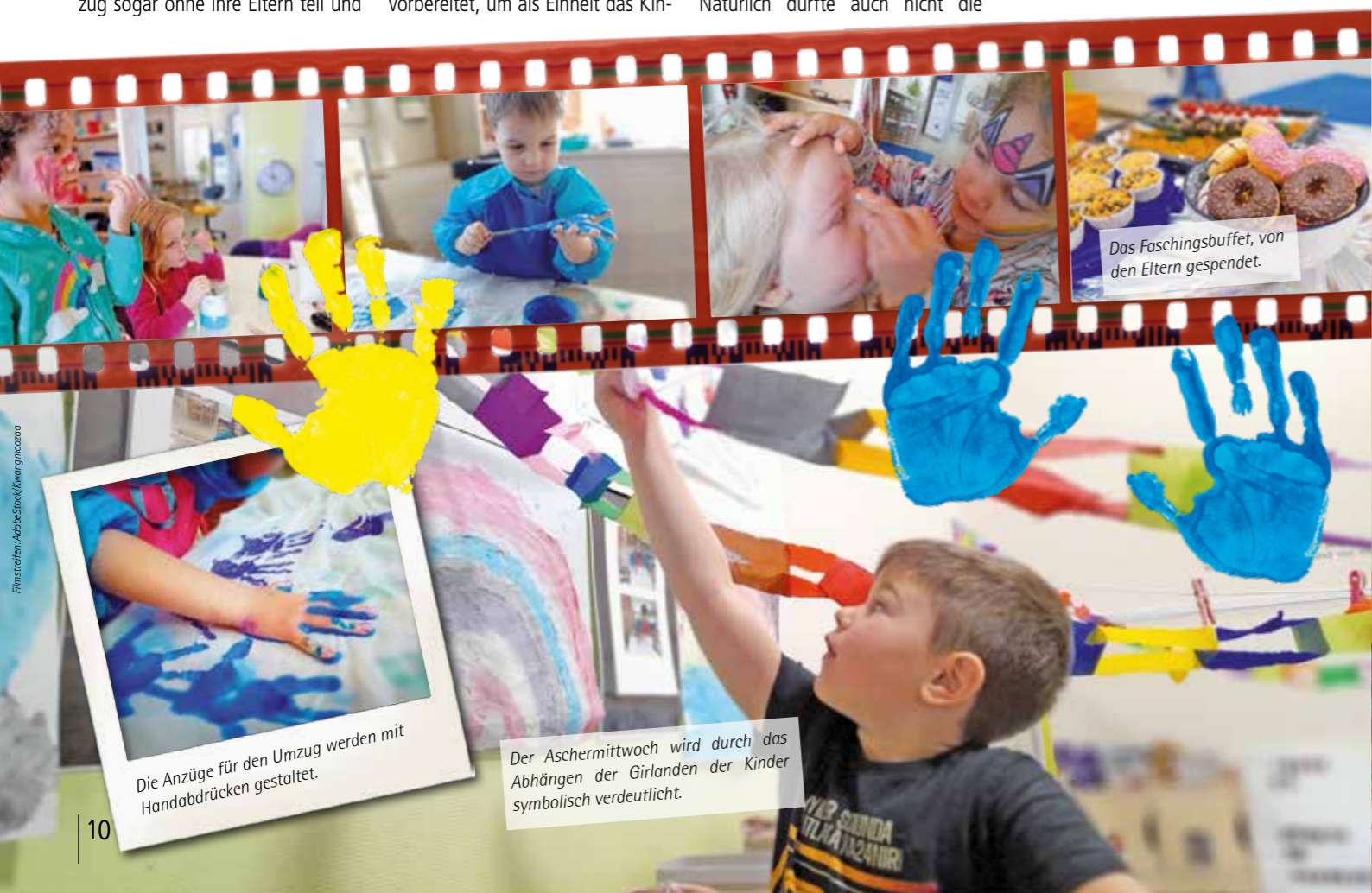
Das Faschingsbuffet, von den Eltern gespendet.

Doch wie heißt es so schön, nach jedem Ende steht ein Neuanfang bevor und so freuen wir uns nun, „Hand in Hand“, auf den bevorstehenden Frühling!