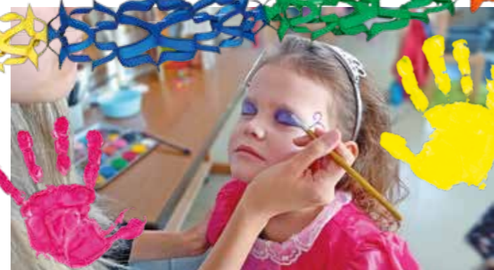
Die Kinder können von unserer FSJ geschminkt werden oder können sich selber schminken.

Die Resonanz war groß. Die Vorschulkinder nahmen an dem Umzug sogar ohne ihre Eltern teil und