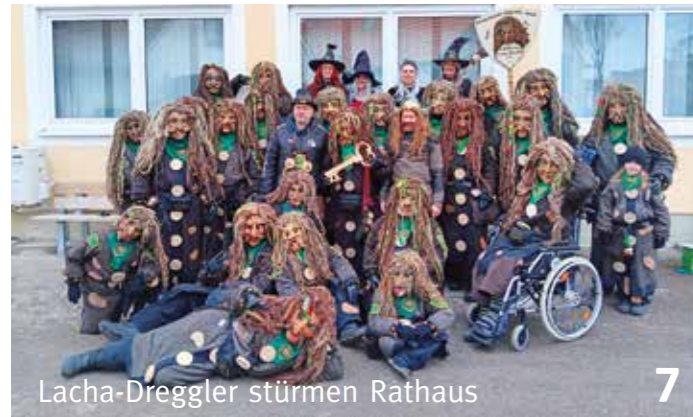
Lacha-Dreggler stürmen Rathaus