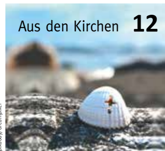
Aus den Kirchen