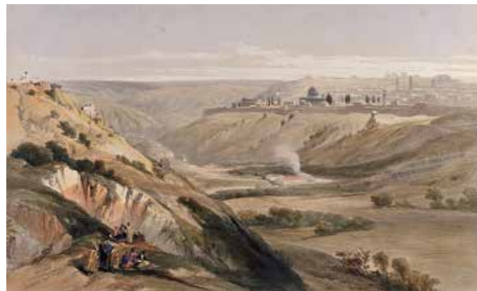
Jerusalem from the road leading to Bethany, East Jerusalem. Coloured lithograph by Louis Haghe after David Roberts, 1842.]

Evangelische Kirchengemeinde in Bellenberg