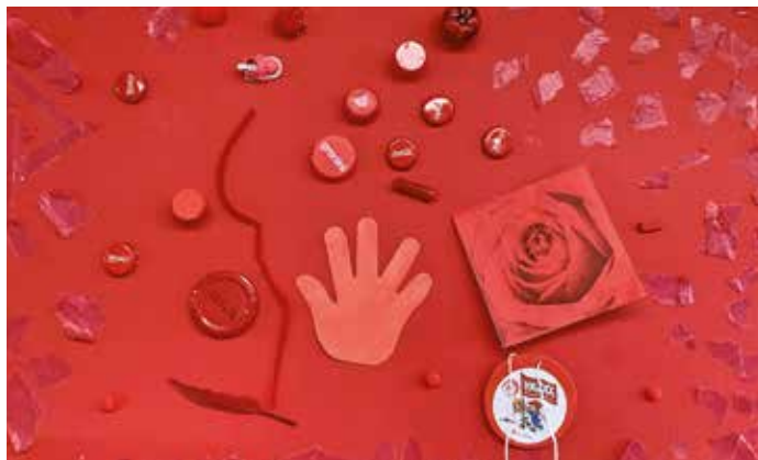
Das rote Plakat entstand durch das Ertasten und Aufkleben vieler roter Alltagsgegenstände.

Um die Neugier der Kinder zu wecken, wurden viele abwechslungsreiche Angebote vorbereitet. Die Geschichte „Der dicke rote Apfel“ machte die Farbe hörbar. Beim anschließenden Tupfen eines Apfelbildes mit Fingerfarbe konnten die Kinder Rot ertasten und kreativ gestalten. Ergänzt wurde das Angebot durch ein großes rotes Plakat, das gemeinsam beklebt wurde. Hierfür brachten die Kinder rote Gegenstände von zu Hause mit. Der Fantasie waren keine Grenzen gesetzt – Hauptsache rot. So fanden unter anderem Deckel von Colaflaschen, Papierschnip-