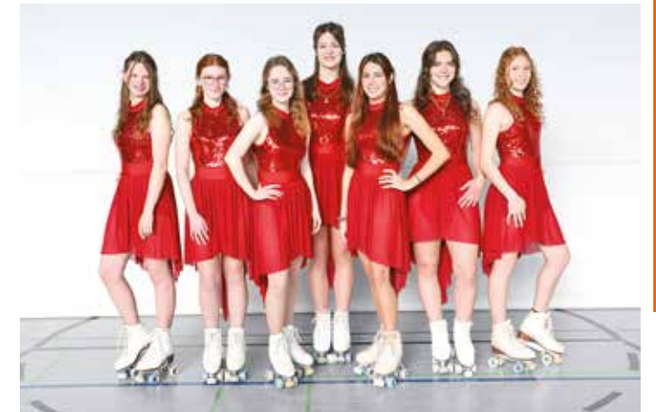
Diese Läuferinnen sind dieses Jahr bei der Show.

ist bereits ab 14.30 Uhr. Beide Termine bieten das identische abwechslungsreiche Programm.