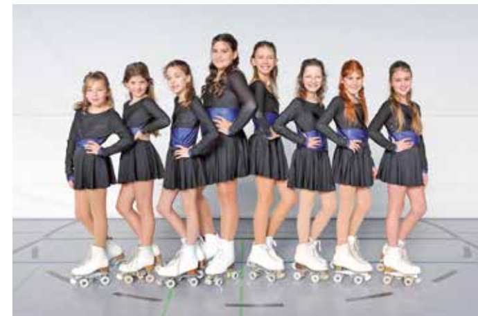
Diese Läuferinnen sind dieses Jahr bei der Show.

Die Abteilung Rollkunstlauf feiert in diesem Jahr ihr 10-jähriges Jubiläum und lädt aus diesem besonderen Anlass wieder zu einer mitreißenden Show ein. Seit einem Jahrzehnt steht die Abteilung Rollkunstlauf des ASV Bellenberg für sportliche Leistung, Teamgeist und kreative Choreografien – Grund genug, dieses Jubiläum gebührend zu feiern. Die Zuschauer dürfen sich auf ein farbenfrohes Spektakel mit stimmungsvollen Lichteffekten, glitzernden Kostümen und vielen wunderbaren Momenten freuen.