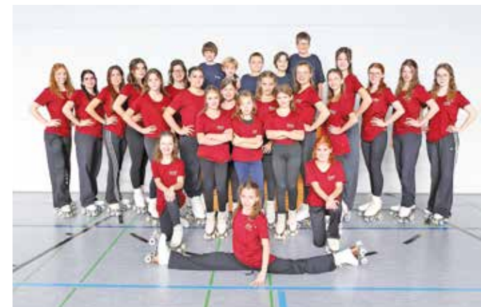
Diese Aktiven sind bei der Jubiläumsshow dabei; Foto der kompletten Abteilung.

Die große Jubiläumsshow findet in der ASV-Halle an zwei Tagen statt. Am Samstag, den 28.02., beginnt die Vorstellung um 17 Uhr, der Ein- lass ist ab 16.30 Uhr. Am Sonntag startet die Show um 15 Uhr, Einlass