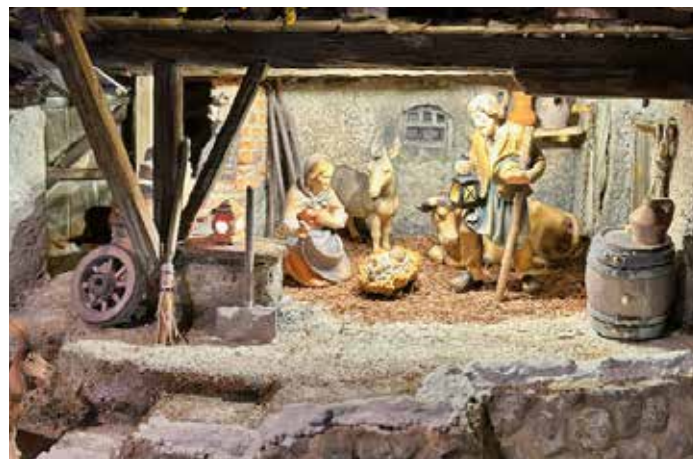
von der Führung durch die Ausstellung mit den über 50 Krippen sehr begeistert. Noch bis Maria Lichtmess ist die Schau jeweils Fr. bis So. von 14 bis 17 Uhr geöffnet.