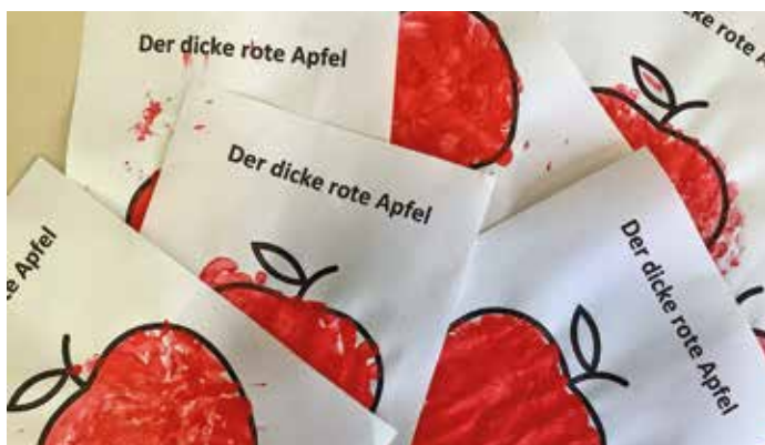
Rot konnten die Kinder auch spüren und fühlen, indem das Apfelbild mit Fingerfarbe ausgestupft wurde.

Mit großer Freude und Neugier blicken die Kinder bereits auf die nächste Reise ins Farbenland, wenn sich ihnen eine neue Farbe vorstellt. ■