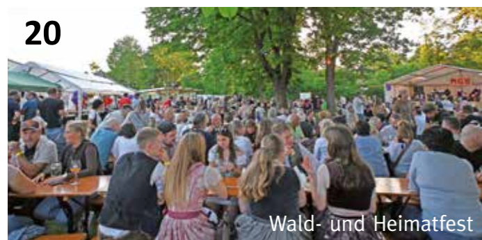
Wald- und Heimatfest 20