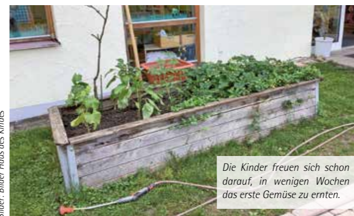
Die Kinder freuen sich schon darauf, in wenigen Wochen das erste Gemüse zu ernten.

Das Haus des Kindes „Guter Hirte“ bedankt sich herzlich beim örtlichen Obst- und Gartenbauverein sowie bei den Mitarbeitern des Bauhofs für ihre wertvolle Unterstützung und ihr Engagement. Durch ihre Hilfe wird es den Kindern ermöglicht, die Natur hautnah zu erleben und erste Erfahrungen im Gärtnern zu sammeln.