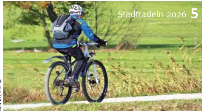
Stadtradeln 2026 5