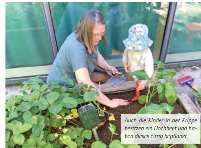
Auch die Kinder in der Krippe besitzen ein Hochbeet und haben dieses eifrig bepflanzt.

Rund um die Pfingstzeit wurde es im Garten des Hauses des Kindes „Guter Hirte“ besonders geschäftig. Die Kinder schlüpfen in die Rolle kleiner Gärtnerinnen und Gärtner und bepflanzen mit viel Freude und Engagement die Hochbeete des Kindergartens.