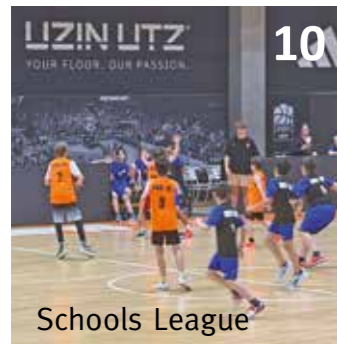
Schools League 10