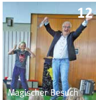
Magischer Besuch 12